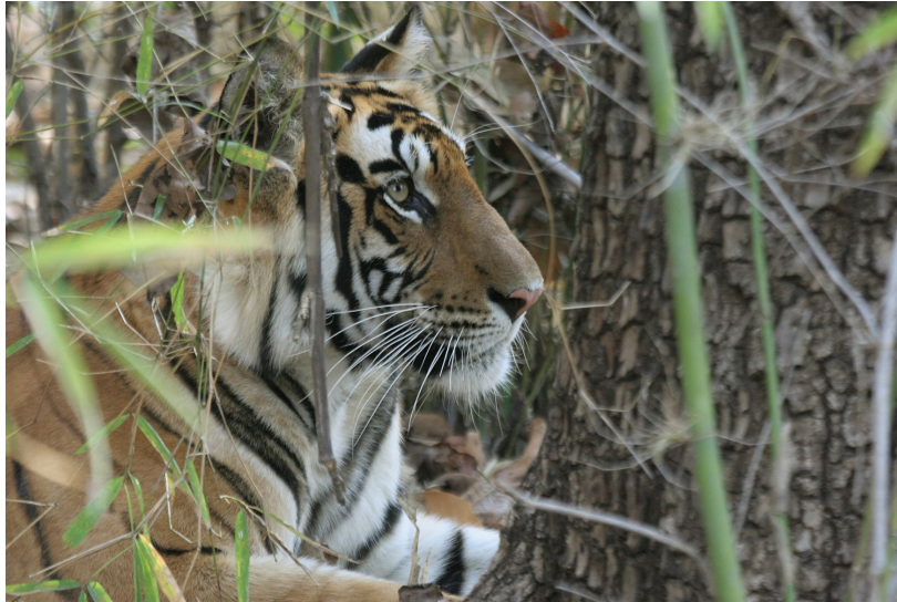
Fig. 5 Tigre del Bengala