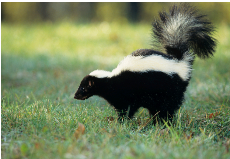
Fig. 4 Moffetta

La colorazione ha quindi il vantaggio di allontanare il predatore ancora prima che incominci il suo attacco, con evidente beneficio della preda per la quale, a volte, anche un semplice morso potrebbe essere fatale. Si è osservato che i colori aposematici utilizzati dalle varie specie sono pochi: i colori principali sono il giallo, il rosso, l'arancio e l'azzurro, in genere collocati su uno sfondo tale da esaltare il contrasto come nero o bianco. Gli accostamenti particolarmente diffusi sono il rosso e il nero, e, ancora di più, il giallo e il nero. Nel regno animale tra gli esempi più comuni ricordiamo tra gli insetti l'ape, la vespa, la coccinella, tra i pesci gli scorfani e i pesci chirurghi, tra gli anfibi le rane tropicali e le salamandre, tra i rettili il serpente corallo e tra i mammiferi la moffetta (Fig. 4) dal tipico colore bianco e nero.