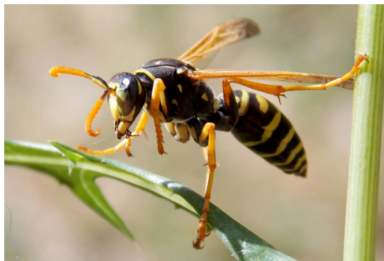
Fig. 3 Vespa