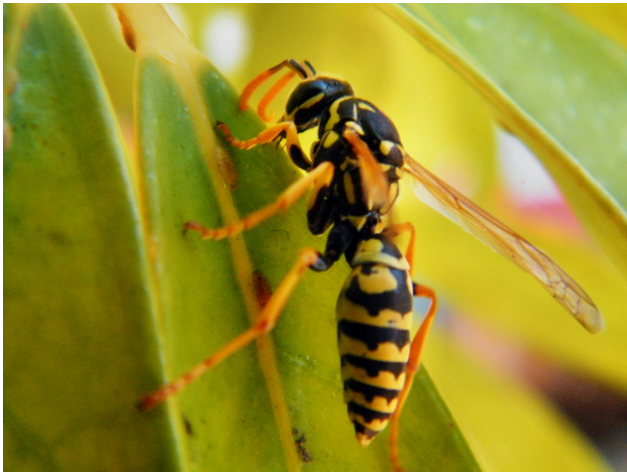
Fig. 3 Vespa