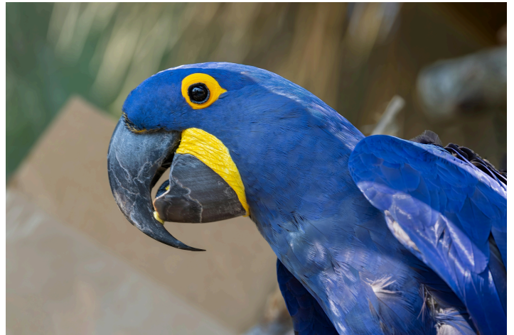
Fig. 4 Ara giacinto