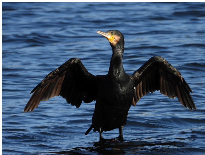
Fig. 5 Cormorano

Nel caso del cormorano (Fig.5), tipico uccello dal piumaggio nero, la cheratina contenuta nelle penne e nel becco diventa più resistente quando si lega a particelle di melanina. Inoltre il nero assorbe il calore del sole permettendo agli uccelli di essere attivi fin dal primo mattino in inverno e di asciugarsi più in fretta al sole quando sono bagnati.