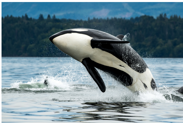
Fig. 6 Orca

Nelle orche le macchie bianche e nere potrebbero essere una forma particolare di camuffamento per mascherare la sagoma dell'animale, soprattutto in ambiente soleggiati dove le ombre sono molto nitide. In questo modo l'orca riuscirebbe ad avvicinarsi indisturbata alle sue prede (Fig. 6).