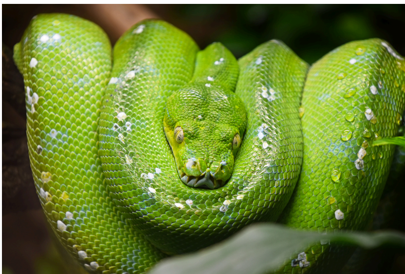
Fig. 2 Pitone verde

Esistono molti animali verdi, come rane e serpenti (Fig.2), ma il loro colore non è dovuto alla presenza della clorofilla, come nelle piante, ma è il risultato dell'associazione blu e giallo. La loro pelle infatti contiene pigmenti gialli e marroni ma anche piccole particelle incolori che creano riflessi bluastri al passaggio della luce. I mammiferi sono invece incapaci di sintetizzare il verde, solo il bradipo per mimetizzarsi nel verde usa un'alga simbiote che cresce sulla sua pelliccia.